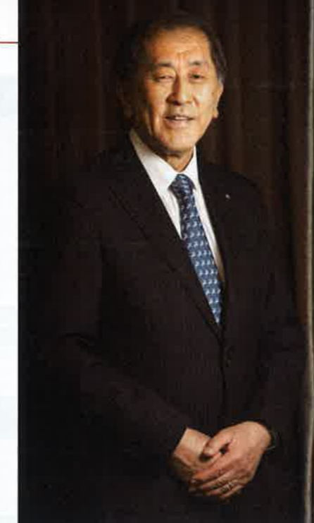
たなか あいじ/1951年、東京都出身。早稲田大学政治経済学部卒。米オハイオ州立大学大学院で政治学博士号取得。2018年11月から早稲田大学総長